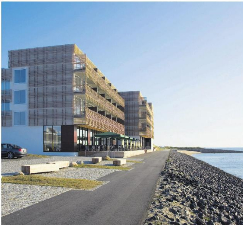
Zeitgenössischer Akzent am Meer: das Hotel Budersund von Patrik Dierks und DKO-Architekten. .../.../...

Neubauten verleihen der Südspitze von Deutschlands nördlichster Ferieninsel ein neues Aussehen